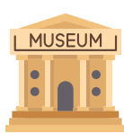
2. le musée