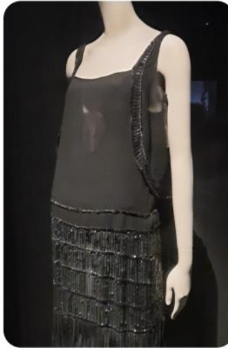
Robe Printemps - Été 1926. Crêpe de soie noire brodée de paillettes noires

Ainsi, en , Gabrielle Chanel lance son modèle de petite robe noire . Si la créatrice parisienne ne l'a pas inventée, elle en fait la pièce élégante et intemporelle qu'on connaît aujourd'hui.