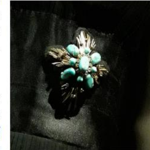
Broche Chanel & Goossens. Printemps - Été, 1959. Métal doré, pâte de verre turquoise, strass. Paris, Patrimoine de CHANEL.

Convaincu de ce nouveau modèle, le magazine américain Vogue publie un croquis de la , rebaptisée la "Ford de Chanel" , autrement dit, la robe que tout le monde peut avoir dans sa garde-robe.